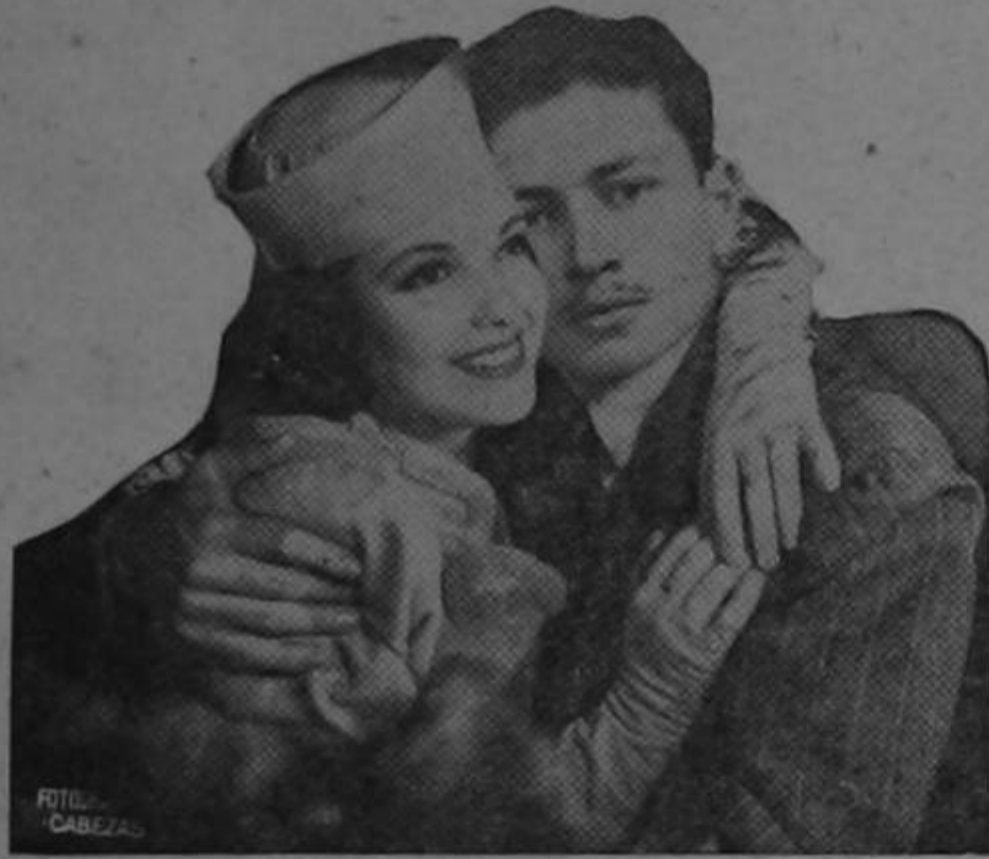
Uno que está bien agarrado.

Don Fernando Soto Harrison, designado por el señor Presidente electo para el cargo de Secretario de Gobernación, acaba de ser nombrado para desempeñar ese alto puesto en el actual gobierno.